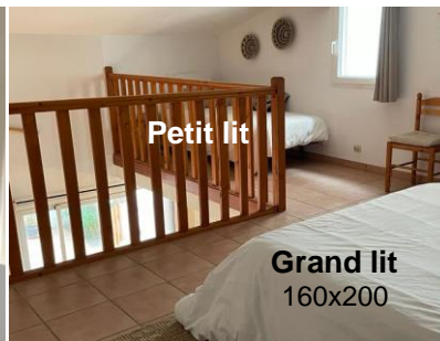
Mezzanine (vue 1)