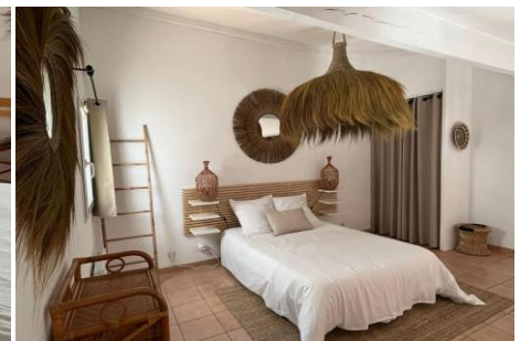
Mezzanine (vue 2)